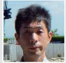
北村 薫 カメラの七桜