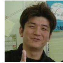
三浦 一志 ヘアーサロン髪切屋